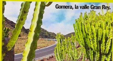
Gomera, la valle Gran Rey.

COME ARRIVARCI Volo low cost per Tenerife dai principali aeroporti italiani e transfer con navi Fred Olsen (€ 52 a/r).