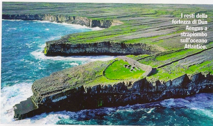
I resti della fortezza di Dún Aengus a strapiombo sull'oceano Atlantico.

paesaggio lunare e del silenzio. Puoi affittare una bici e raggiungere Dún Aengus, fortezza a picco sul mare, tra le meglio conservate in Europa: guardare in giù verso l'oceano Atlantico è da brivido. Solo sull'isola trovi i tipici pull lavorati con la tecnica Aran: ti consiglio l'Aran Sweater Market & Museum ( clanarans.com ).