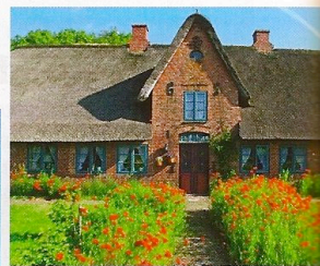
A lato, un cottage dell'isola di Sylt; sotto: le tipiche "poltrone da spiaggia" tra le dune.

LA COSMODRITTA Per i tuoi sfizi golosi, l'indirizzo imperdibile è Café Wien ( cafe-wien-sylt.de ). Sembra la casa di marzapane di Hänsel e Gretel, piena di torte di lamponi, praline e gelati. E se adori il cioccolato, puoi scoprirne i segreti in un corso di 3 ore. COME ARRIVARCI In aereo (da Roma Fiumicino € 76 circa; da Milano Malpensa € 94; airberlin.com ) o col treno che prendi nella città tedesca di Niebüll (percorre la diga che collega la terraferma col paese di Westerland a Sylt; puoi caricare anche l'auto).