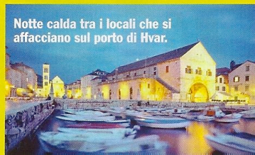
Notte calda tra i locali che si affacciano sul porto di Hvar.

LA COSMODRITTA Fai tappa al Carpe Diem per sorseggiare i suoi squisiti cocktail seduta nella grande terrazza, circondata dal verde e illuminata dalla luna. COME ARRIVARCI Su edreams.it trovi voli per Split (Spalato) da € 99; da lì prendi il traghetto che ti porta fino al porto di Hvar (da 47 Kuna, la moneta croata, cioè circa € 6,50).