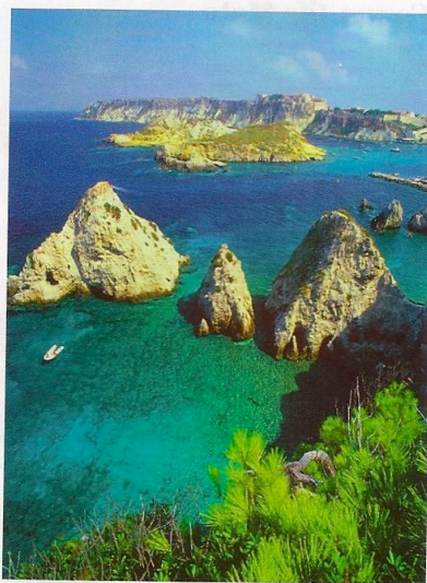
Panorama mozzafiato su Cala di Diamante, a San Domino, una delle isole Tremiti. Altro che atolli tropicali: qui trovi un mare che più turchese non si può e fondali tutti da esplorare!

fondali trasparenti dalle sfumature blu, verdi e turchesi, tutte a... due passi. Puoi anche fare un corso di immersione ( marlntremiti.it ) per conoscere da vicino i pesci e la flora marina. Preferisci poltrire? Rilassati a Cala Matana, a strapiombo sul mare, quella di Luna Matana , la canzone di Lucio Dalla. E la sera ti scateni alla discoteca Diomede ( discotecadiomede.it ) nella piazzetta centrale: propone buona musica e un ricco aperitivo "mangia e bevi".