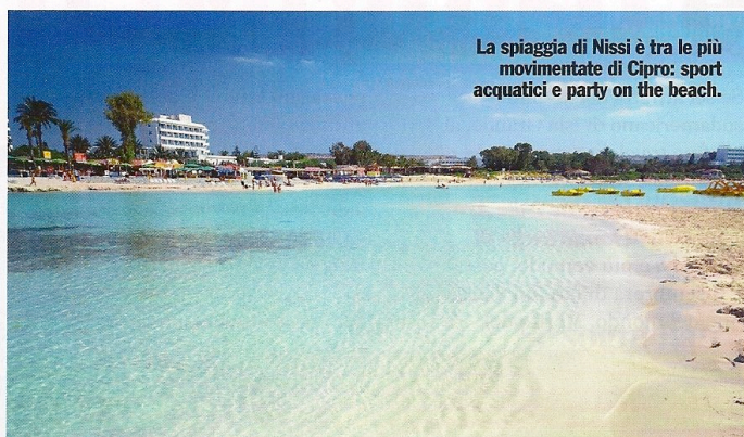
La spiaggia di Nissi è tra le più movimentate di Cipro: sport acquatici e party on the beach.